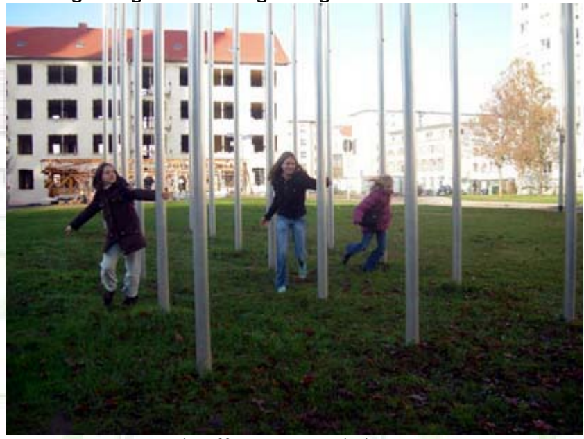
Un échauffement avant le jour « J » !