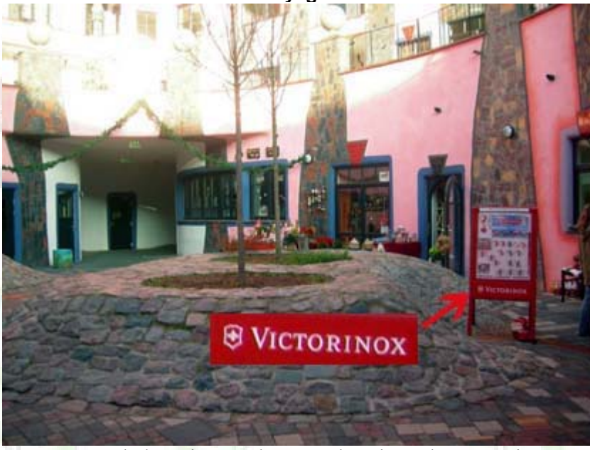
Un peu de la Suisse... dans une boutique de souvenirs !